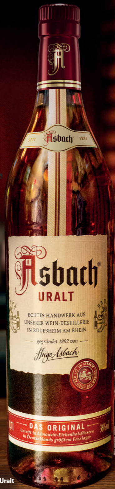
Asbach Uralt 1 x 1,0l Art.-Nr. 432017