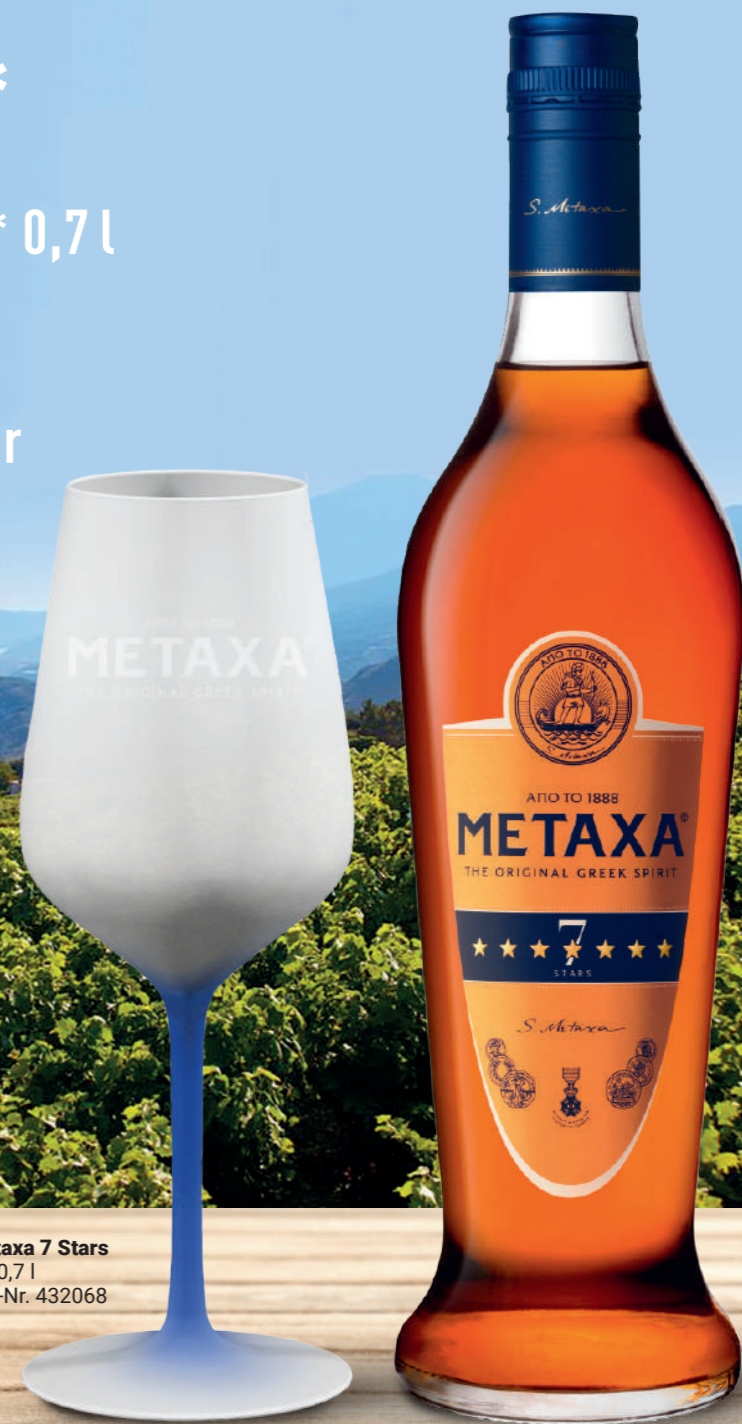
Metaxa 7 Stars 1 x 0,7 l Art.-Nr. 432068