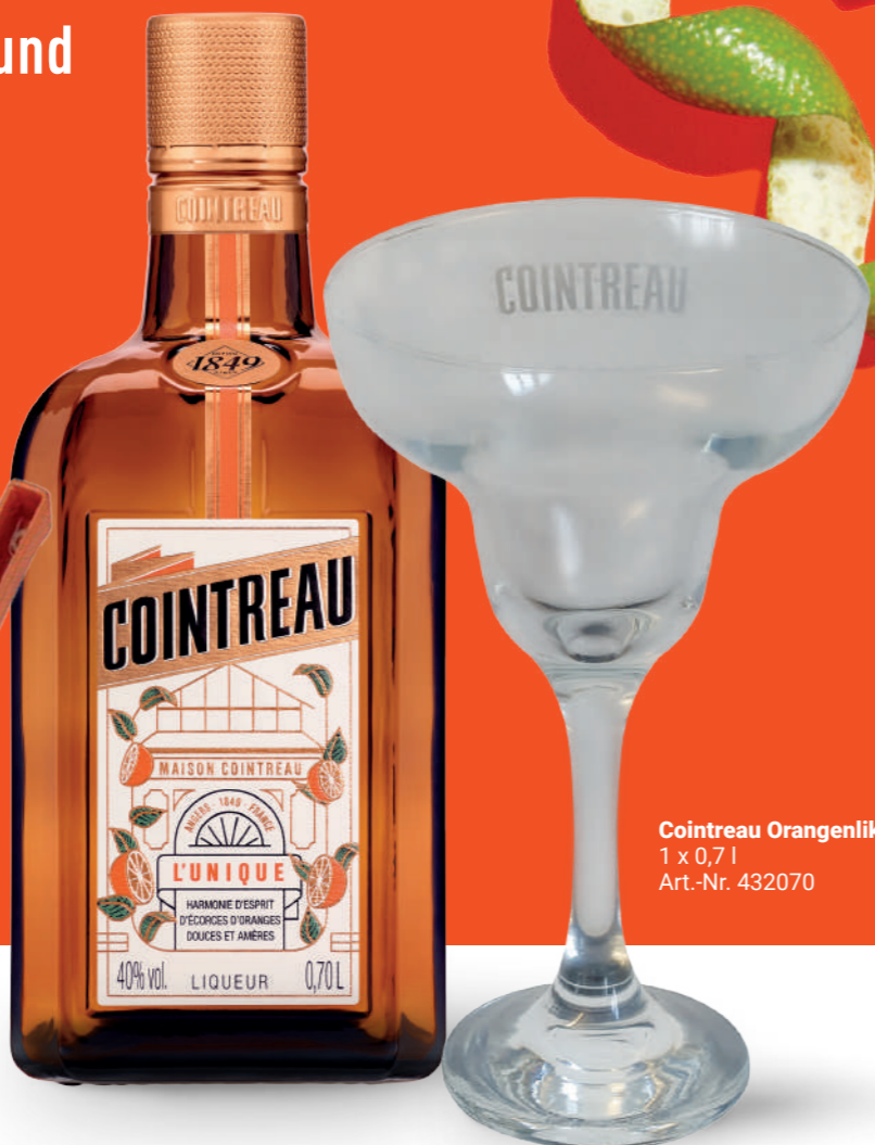
Cointreau Orangenlikör 1 x 0,7 l Art.-Nr. 432070