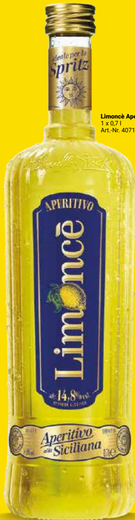
Limoncè Aperitivo 1 x 0,7l Art.-Nr. 407195